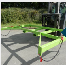
CRP07000 – version avec flèches fixes

⚠ VÉRIFICATION RÉGLEMENTAIRE : Avant toute mise en service, procéder à l'examen d'adéquation entre l'accessoire de levage, le chariot et l'utilisation.