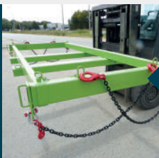
Chaînes maintenues après utilisation