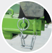
CRP17000 Blocage sur fourches par axes amovibles