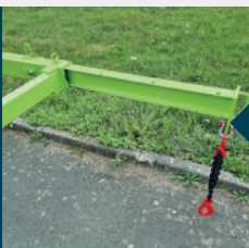
Flèche démontable interchangeable