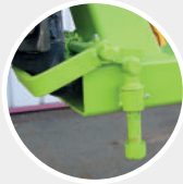
CRP27000 Blocage avec sécurité automatique