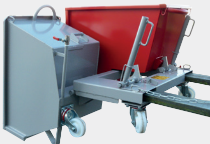
2 caisses de 150 litres