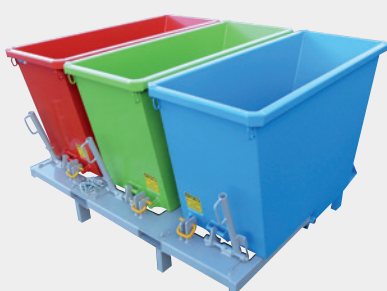
3 caisses de 450 litres